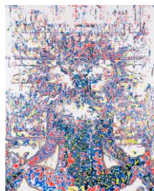
Martin Groß, SIRI. (Industry Painter on paper, 185,0 x 150,0 (2018)