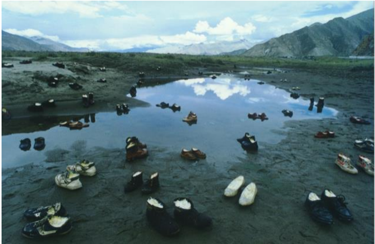
Yin Xiuzhen Shoes with Butter, Tibet-Lhasa , C-Print, 120 x 180 cm (1996). Foto: Yin Xiuzhen

Gruppenausstellung kuratiert von Harald F. Theiss