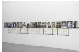
Texte: Handsiebdruck auf Glas, Goldlack, Barytpapier, Messingrahmen Portraits: Tinte, Barytpapier, Glas, Aluminiumrahmen, 104 x 900 cm