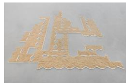
Diango Hernández, Melodia. Sand on wood 200 x 200 cm / 78 6/8 x 78 6/8 in (2018)