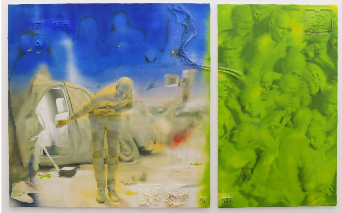
Simon Lehner, Safe Crash - revised . Acrylic on unique foam plate, lens based CNC Painting. 200 x 320 x 10 (2023). Credits: Simon Lehner, Galerie KOW