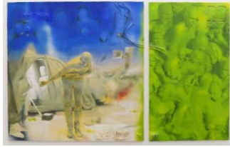
Simon Lehner, Safe Crash - revised. Acrylic on unique foam plate, lens based CNC Painting 200 x 320 x 10cm (2023)