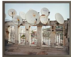
Kader Attia, Parabolic Self Poetry. Light box 128 x 159 x 20 cm / 50 3/8 x 62 5/8 x 7 7/8 in. Edition no.: 1/3 (2015)