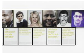
Sven Johne, Anomalien des frühen 21. Jahrhunderts; Einige Fallbeispiele 2015/2017 (Detail und Ausstellungsansicht)