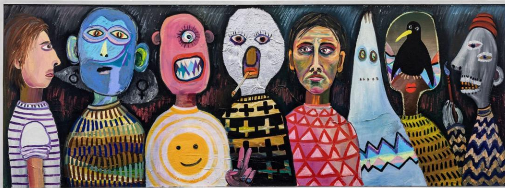
Oska Gutheil Me And Other Me , Öl auf Leinwand, 80 x 220 cm (2019). Abbildung: Oska Gutheil

Die Ausstellung WHERE ARE WE NOW oder die Suche nach dem Danach lädt dazu ein, Perspektiven und Wandel in den Gesellschaften zu reflektieren und das Vertraute in andere bildnerische Sprachen zu übersetzen. Sie liefert relevante Impulse für eine Zukunft, in der Authentizität, Utopie und kollektive Visionen eine immer wichtigere Rolle spielen. Indem sie Gedanken über das Mögliche anregt und ein universelles Stimmungsbild erfahrbar macht, trägt sie dazu bei, eine neue ästhetische Vorstellung des Daseins auf der Suche nach dem Danach zu entwickeln.