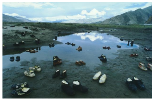
Yin Xiuzhen, Shoes with Butter, Tibet-Lhasa C-Print, 120 x 180 cm (1996)